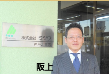
神戸北支店 支店長 神戸北支店を統括しています。